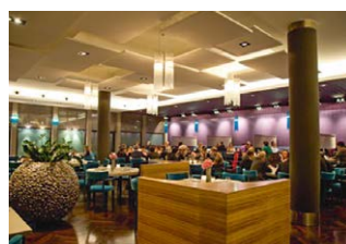
„Living Room“ heute

ab 19.00 Uhr Abendveranstaltung Gemeinsames Essen im größten Wohnzimmer Bochums – Willkommen im „Living Room“: Nach der Idee der heutigen Betreiber eröffne- te im November 2000 der LIVINGROOM. Nach über einjähriger Planungs- und Umbauphase in enger Zusammenarbeit mit dem Architekturbüro Andrea Wisk entstand in den Räumen der ehemaligen Bürgergesellschaft ein 450 m 2 -Loft mit einer Kapazität von 250 Plätzen und damit das innovative Bar-, Lounge- und Restaurant- konzept: LIVINGROOM.